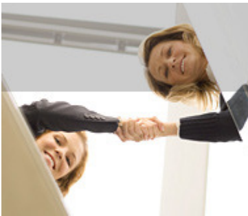
Gemeinsam handeln mit Prinzip

800 Millionen Menschen sind weltweit Mitglied einer Genossenschaft: unsere Gründer Friedrich-Wilhelm Raiffeisen und Hermann Schulze-Delitzsch haben ein globales Erfolgsmodell entwickelt! Weltweit hat keine andere Unternehmensgruppe einen vergleichbar breit gestreuten Anteilsbesitz wie wir.