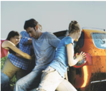
Profitieren Sie als Mitglied von vielen Vorteilen!